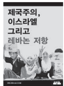
제국주의, 이스라엘 그리고 레바논 저항 알렉스 캘리니코스 외 / 3,000원