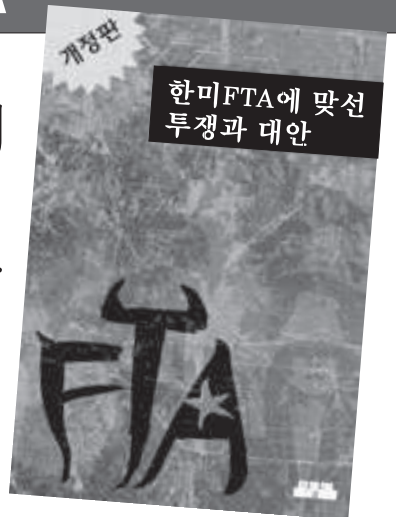
이정구 외 / 3,000원