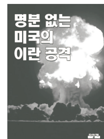
명분 없는 미국의 이란 공격 조지 캘리웨이 / 2,000원