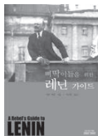
삐딱이들을 위한 레닌 가이드 이안 버철 / 2,000원