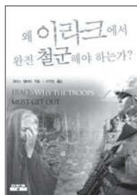
왜 이라크에서 완전철군해야 하는가? 크리스 뱌버리 / 3,000원