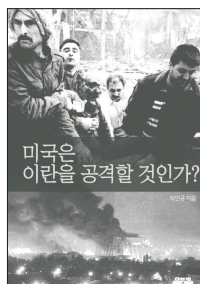
미국은 이란을 공격할 것인가? 박인규 / 2,000원