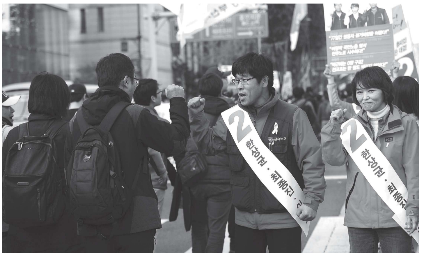
박근혜의 공세에 맞서 투쟁을 이끌 지도부가 필요하다.

특히 박근혜 정부가 ‘정규직 과보호’, ‘철밥통’ 운운하며 정규직 노동자들의 임금, 연금, 고용 등에 맹공을 퍼는 상황에서, 정규직 노동자들의 투쟁을 적극 엄호하겠다고 밝히는 것도 장점이다. 한상균 후보 조는 정규직·비정규직의 단결을 강조하며, 정규직 노동자들이 비정규직 투쟁에도 적극 연대할 수 있도록 설득·조직하겠다고